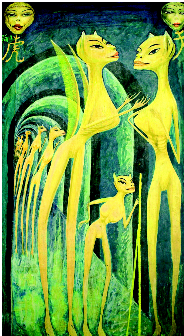
Ovartaci: Den kinesiske formel

Hvad betyder kunst for dig? Kan du godt lide at tegne/male? Hvad synes du er god kunst?